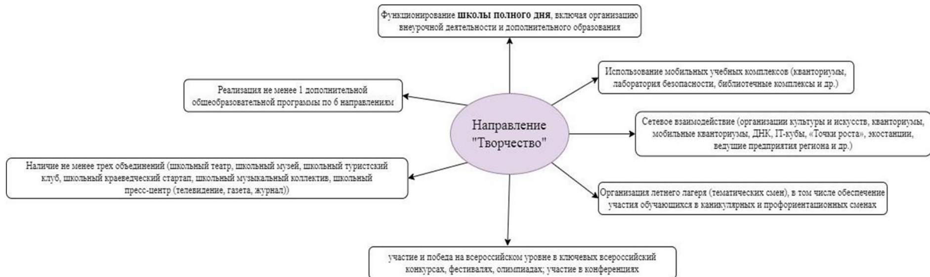
Рисунок 3. Критерии образовательного пространства по направлению «Творчество»

Перечень мероприятий по направлению «Творчество» в рамках достижения модели «Школы Минпросвещения России» представлен на рисунке 3.