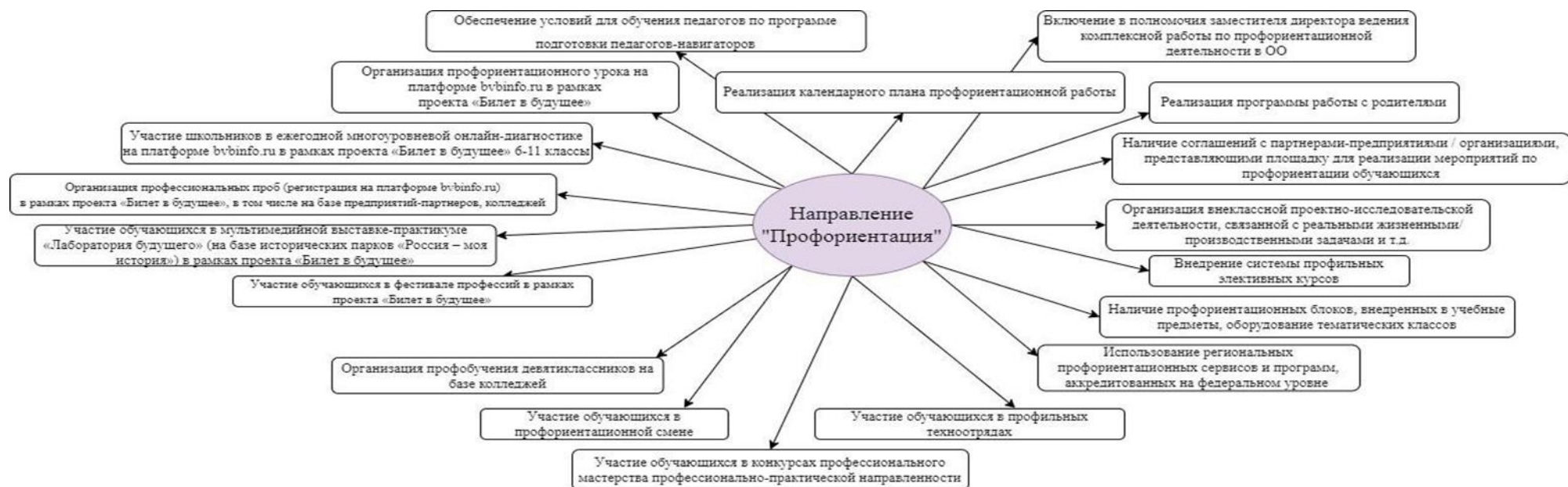
Рисунок 4. Критерии образовательного пространства по направлению «Профориентация»