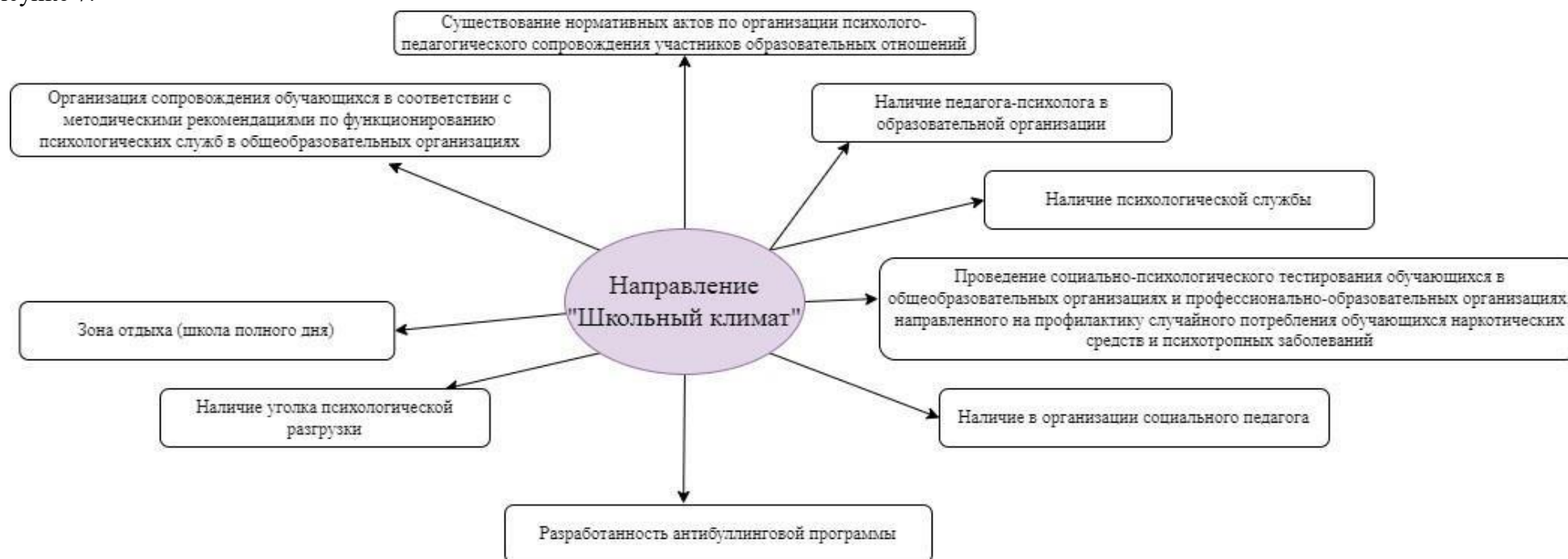
Рисунок 7. Критерии образовательного пространства по направлению «Школьный климат»

Перечень мероприятий по направлению «Школьный климат» в рамках достижения модели «Школы Минпросвещения России» представлен на рисунке 7.