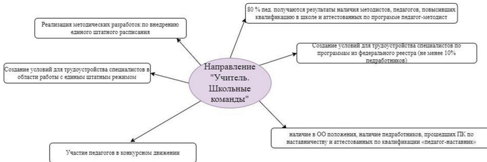
Рисунок 6. Критерии образовательного пространства по направлению «Учитель Школьная команда»