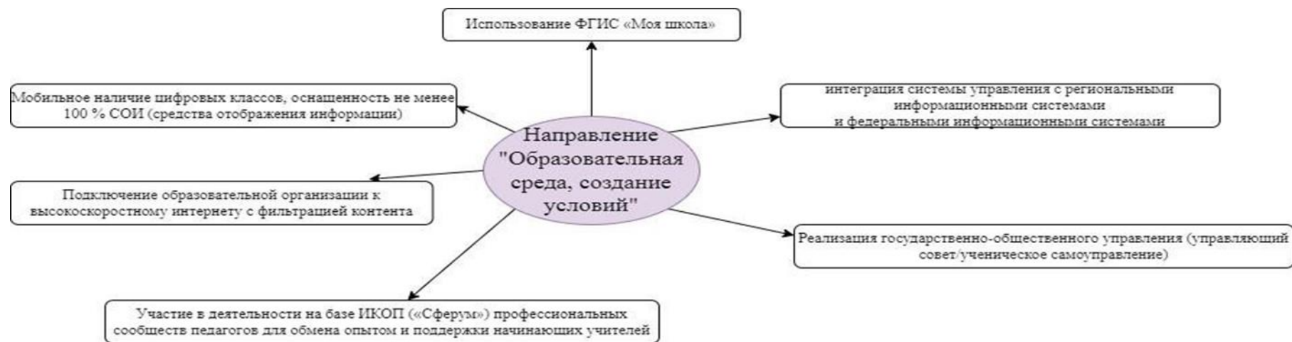
Рисунок 8. Критерии образовательного пространства по направлению «Образовательная среда».